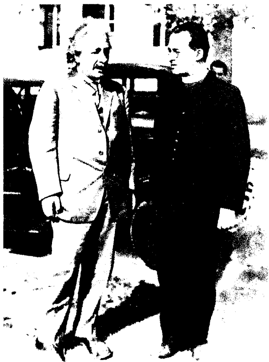
1 Der Bedenker des Urknallmodells Georges Lemaître (rechts) im Jahr 1933 im Gespräch mit Albert Einstein, dessen Allgemeine Relativitätstheorie er zur Berechnung seiner Weltmodelle benutzt hatte.